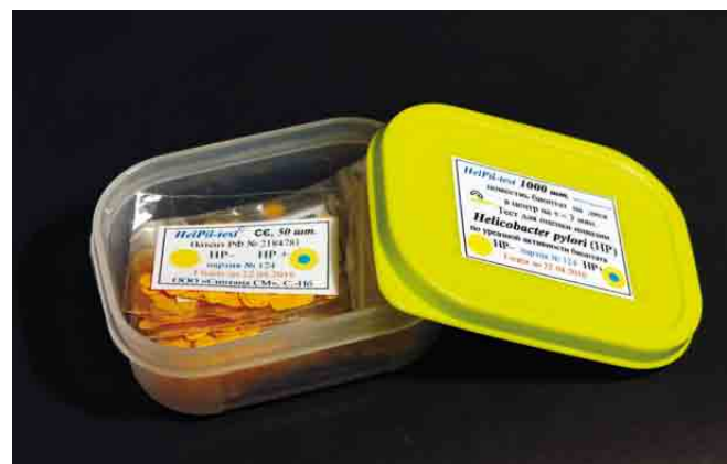
Рис. 2. Тест-система HelPil-test, в упаковке 1000 шт.

изделий. Так компания ООО «АМА» (с 1997 года по 2003 год), ООО «Синтана СМ» (с 1999 года по настоящий момент) и ООО «Ассоциация Медицины и Аналитики» (с 2003 года по настоящий момент) выпускали или продолжают выпускать тест-системы с различным закреплением диска HELPIL-тест на полимерную пленку в составе держателя из картона. Аналогичную продукцию под наименованием HelPil-tests , как и «жидкий» уреазный тест, выпускает SIA "MedPro", Латвия. С 2009 года ООО «Ассоциация Медицины и Аналитики» приступила к выпуску теста под названием ХЕЛПИЛ®лента, где группа дисков закреплена на нейтральную по отношению к тест-системе ХЕЛПИЛ® клеевую основу.