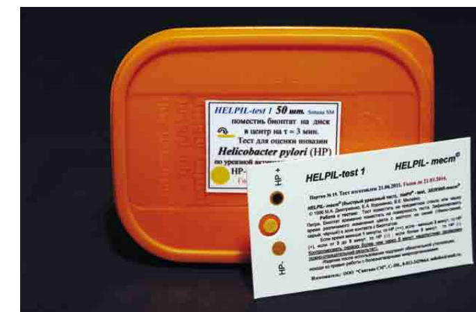
Рис. 3. Тест-система HELPIL-тест 1, где впитывающий диск закреплен на держателе из ламинированного картона.

оказаться в газовой среде помещения в результате применения дезинфектантов или моющих средств, содержащих летучие амины. Кроме того анализ, проводимый одновременно на близко расположенных тест-системах может привести к ложному срабатыванию одной из них. К «дизайнерским» недостаткам можно отнести и то, что тест в контакте с другими материалами может утратить свои диагностические свойства или изменить аналитические характеристики. Например, картон и многие сорта бумаги обладают уреазной активностью и прямой контакт с ними может привести к лож-