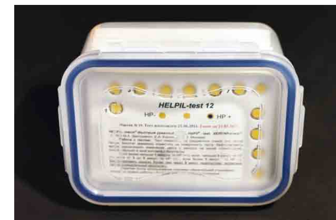
Рис. 5. Тест-система HELPIL-тест12 и его стандартная упаковка (контейнер, содержащий 100 бланков).

но-положительному результату анализа. Поэтому при закреплении дисков HelPil-test на картонном носителе в тест-системах под названиями HELPIL-тест 1 (рис. 3), HELPIL-тест 3 (рис. 4), HELPIL-тест 12 (рис. 5) их приходится изолировать от картона, так как сам картон не является стерильным материалом и как таковой уже содержит уреазу различного происхождения. В этих тест-системах