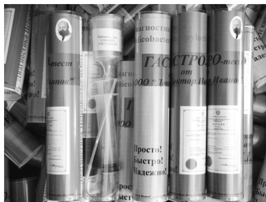
Рис.1. Различные индикаторные трубки применявшиеся и применяющиеся для диагностики Helicobacter pylori по воздуху ротовой полости.

Этот метод анализа с использованием одноразовых индикаторных трубок постоянно совершенствуется, как в плане улучшения методики применения индикаторных трубок, так и в плане конструкции самих линейно-колористических одноразовых газоанализаторов – индикаторных трубок.